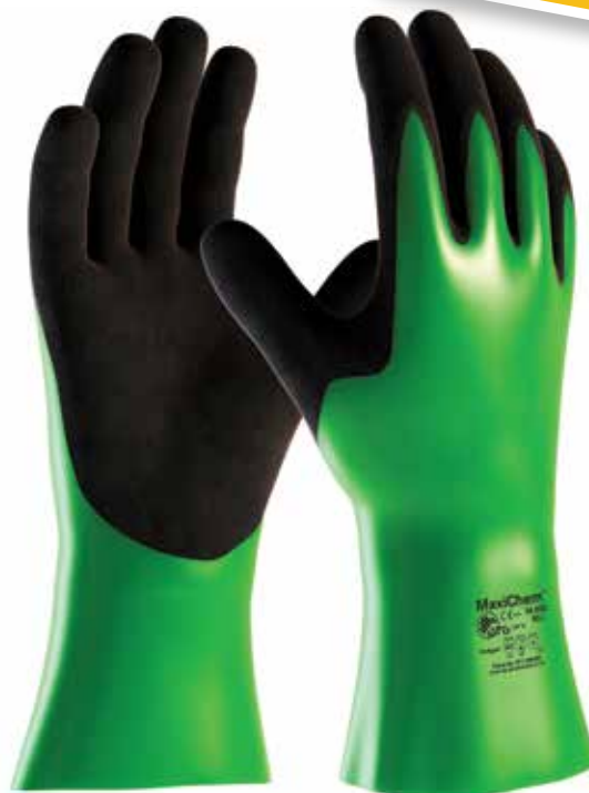
Plate-forme technologique HandCare®